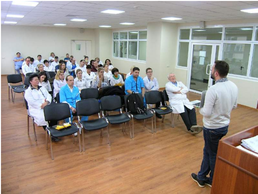
Лекция для врачей и научных сотрудников ФГБНУ «Лыткино»

Целью Дня питания - является повышение уровня знаний и осведомленности о недостаточном питании в учреждениях здравоохранения, методах выявления и её коррекции, и улучшение качества лечебного питания. История создания Всемирного Дня питания началась 16 октября 1979 с учреждения Дня продовольствия (питания) The Food and Agriculture Organization of the United Nations. 12 ноября 2003 была принята Резолюция Совета Европы по продовольствию и нутриционному ведению пациентов в больницах, которая констатировала существование ряда проблем: отсутствие чётко определенной ответственности; отсутствие достаточного образования; отсутствие влияния пациентов; отсутствие взаимодействия между различными службами и структурами; отсутствие заинтересованности администрации лечебных учреждений.