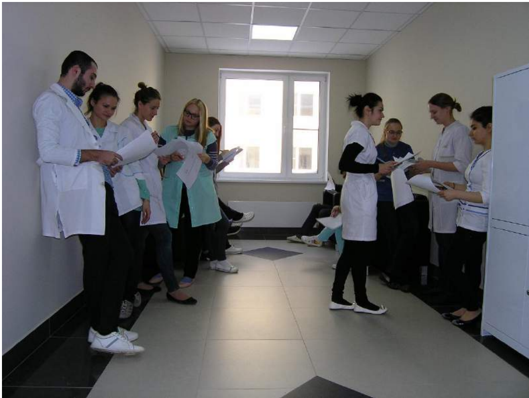
Студенты-медики с анкетами пациентов.