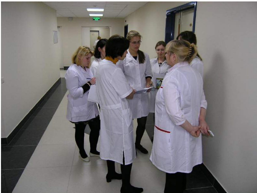
Обсуждение клинического случая и анализ ответов пациентов в процессе анкетирования.