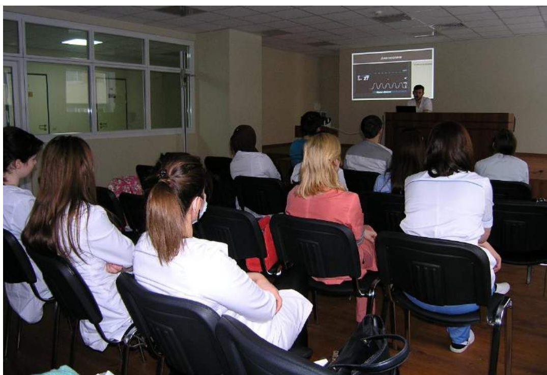
Лекция для студентов и врачей Центра.

Сценарий проекта включал: презентации для врачей продуктов энтерального и сиппингового питания с дегустацией; семинар и мастер-класс для логопедов; анкетирование пациентов, находящихся в отделениях Центра, для выявления дисфагии и недостаточности питания с использованием международных опросников; лекции для врачей и студентов: «Скрининг недостаточности питания» и «Скрининг дисфагии»; лекции для пациентов: «Что делать, если Вам трудно глотать?» и «Как оценить состояние питания?»; обучение студентов и врачей применению опросников для скрининга нарушения глотания и питания в стационаре, антропометрическим измерениям и калиперометрии; дегустация сиппинговых напитков пациентами реабилитационного отделения.