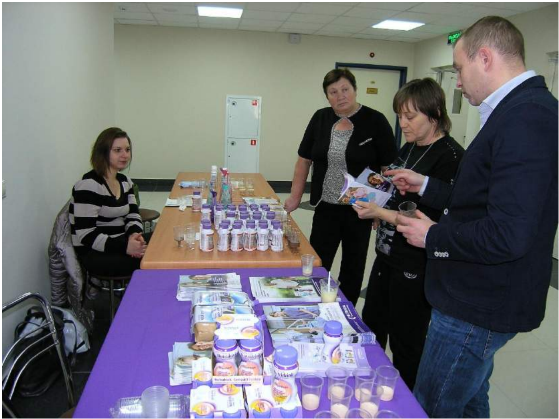
Презентация и дегустация продуктов питания, организованная фирмами Нутриция, Нестле, Фрезениус и Б.Браун. для сотрудников и пациентов ФГБНУ «ГИБ-НЛРЦ»